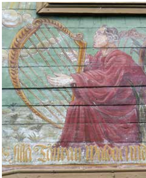
Kung David. Torneå kyrka 1700-tal.