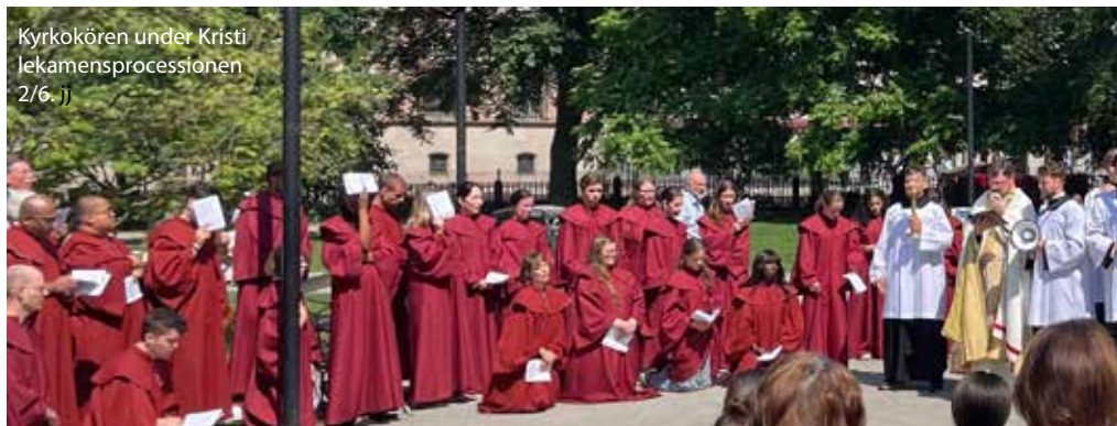
Kyrkokören under Kristi Jekamensprocessionen 2/6. 11

Under hösten sjunger våra körer i de flesta av söndagens högmässor samt i engelska mässan. Kyrkokören åker på en turné till Krakow och dess omgivningarna i mitten av september där de sjunger i ett par mässor och ger ett antal konserter. Som vanligt blir det också ett antal konserter i kyrkan och de som nu är inplanerade är följande: