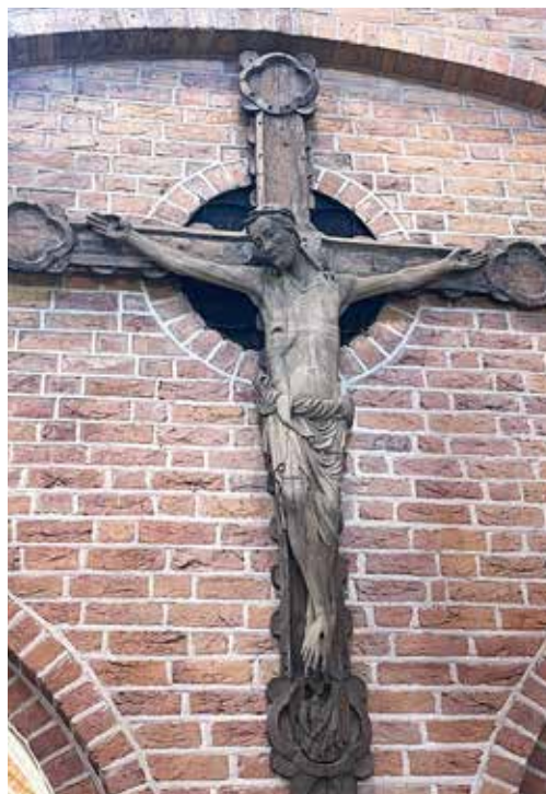
Crucifix in Skokloster church, Uppland, Sweden. 13th century.

🎵 Uganda Choir sings in Mass in English. Please contact: Florence Mukasa, mukf2013@hotmail.com , 070-0373829. Or ugacacos@gmail.com , 073-9550422.