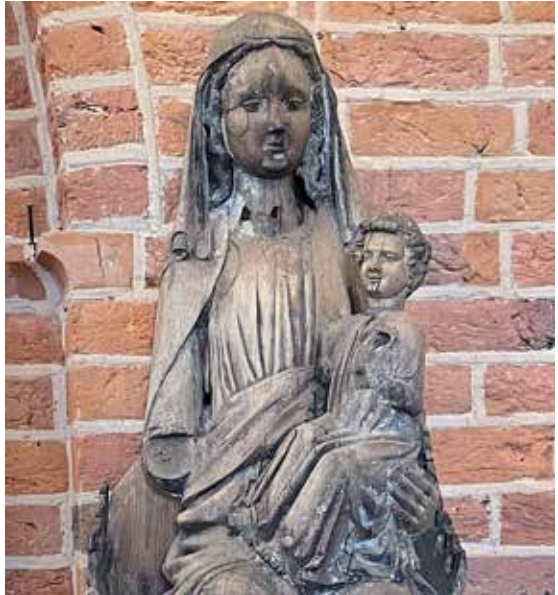
Madonna i Skokloster kyrka, Uppland. 1300-talet.

Christ the King Sunday. The last day of the liturgical year. Mass at 6 pm.