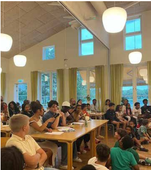
Barnlägret på Marielund sommaren 2024.