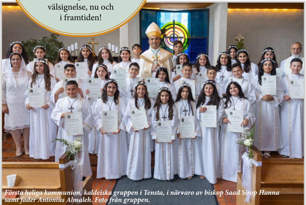
Första heliga kommunion, kaldeiska gruppen i Tensta, i närvaro av biskop Saad Sirop Hanna samt fader Antonius Almaleh.

Under våren och försommaren gick som vanligt ett stort antal barn i församlingen till sin första heliga kommunion. Många ungdomar tog också emot konfirmationens sakrament. Här ses ett urval av bilder från högtiderna. Vi önskar alla barn och ungdomar Guds rika välsignelse, nu och i framtiden!