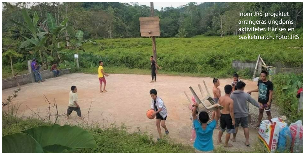
Inom JRS-projektet arrangeras ungdomsaktiviteter. Här ses en basketmatch.

Eugeniadagens kollekt går i år till JRS:s (Jesuiternas flyktinghjälp) fredsbyggde- arbete i södra Filippinerna. År 2017 utbröt strider mellan regeringsarmén och väpnade grupper med koppling till Islamiska staten. Staden Marawi med invånare drabbades hårt av konflikten. Människor fördrevs från sina hem, togs som gisslan eller dödades. Byggnader och infrastruktur raserades. Omkring 17 000 familjer beräknas alltjämt leva som internflyktingar. JRS (insats riktar sig särskilt till kvinnor och ungdomar bland internflyktingarna. De vuxna erbjuds olika former av stöd för att de ska kunna försörja sina familjer, medan ungdomarna engageras i aktiviteter som syftar till att motverka våldsbejakande extremism. Detta senare är viktigt eftersom de unga utgör en viktig rekryteringsbas till regionens väpnade grupper. Vår församling har även tidigare stöttat JRS arbete i Filippinerna. Då behoven fortsatt är stora går Eugeniadagens kollekt änyo till detta ändamål. Genom din gåva kan du göra skillnad för Marawis befolkning.