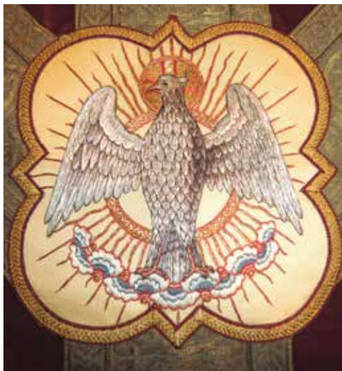
Den Helige Andes duva. Broderi i S:ta Eugenia kyrka.