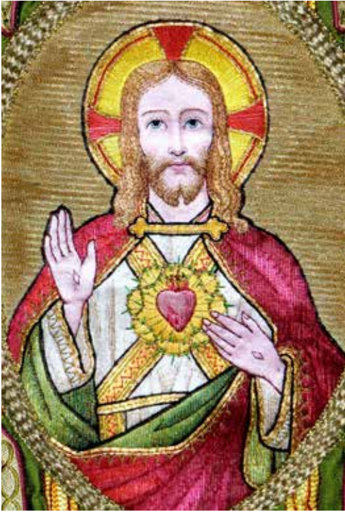
The Most Sacred Heart of Jesus. Embroidery on liturgical textile in St. Eugenia church.

Mass in English. Sundays at 6 pm. For the daily Mass schedule in Swedish, please see page 2.